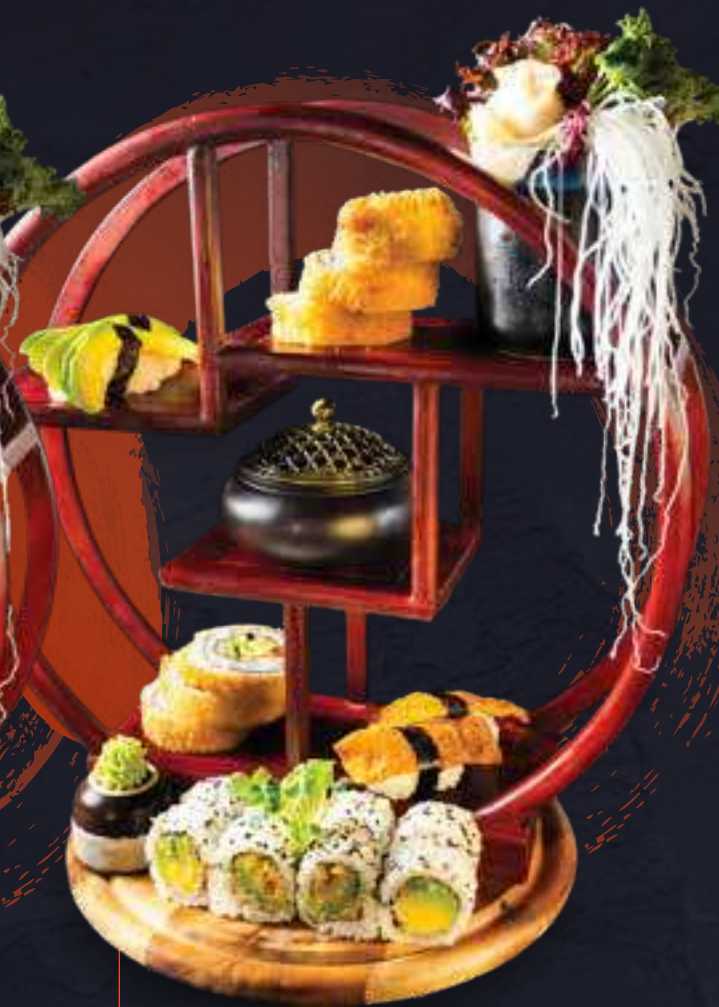
M6. Tempura Veggie Menu a.c.k 19,5 6 Stk. Buddha Rolls 8 Stk. Avocado I.O 2 Stk. Inari Nigiri 2 Stk. Avocado Nigiri