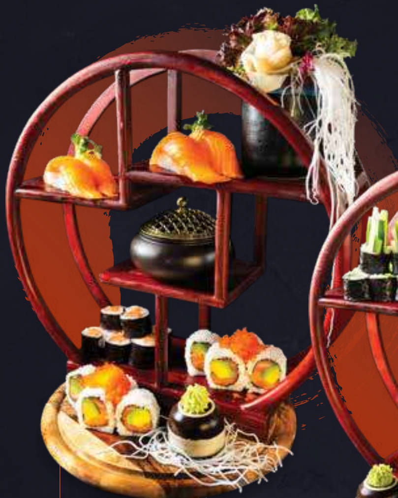
M4. Alaska Menu a.d.k 17,0 8 Stk. Sake I.O 4 Stk. Sake Nigiri 8 Stk. Sake Maki