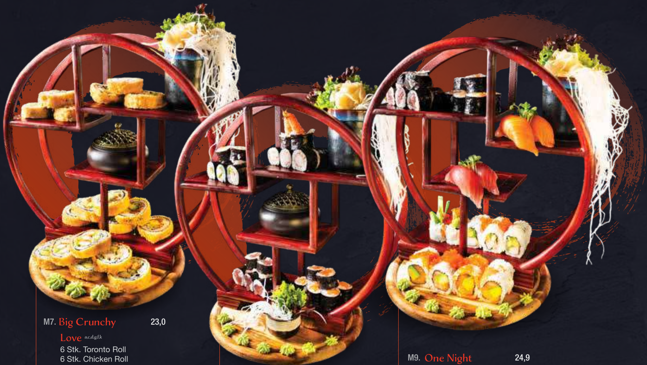
M7. Big Crunchy 23,0