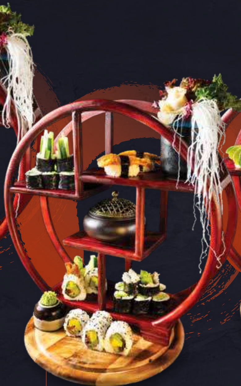
M5. Veggie Menu fk 17,5 8 Stk. Veggie I.O 8 Stk. Avocado Maki 8 Stk. Kappa Maki 2 Stk. Inari Nigiri